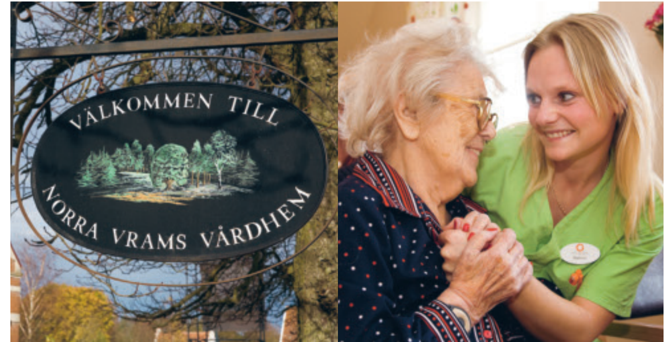
Vi ser varje människa som en individ och tar stor hänsyn till personliga önskemål.